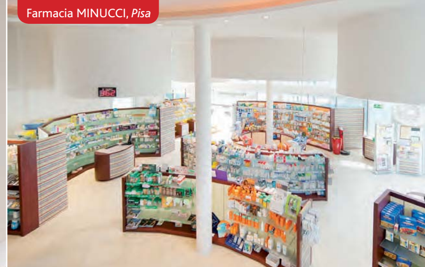
Farmacia MINUCCI, Pisa