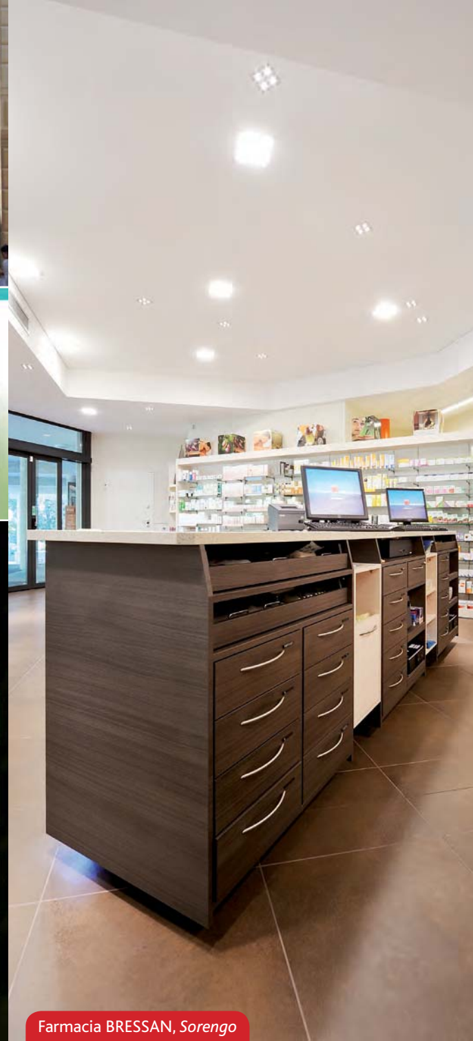
Farmacia BRESSAN, Sorengo