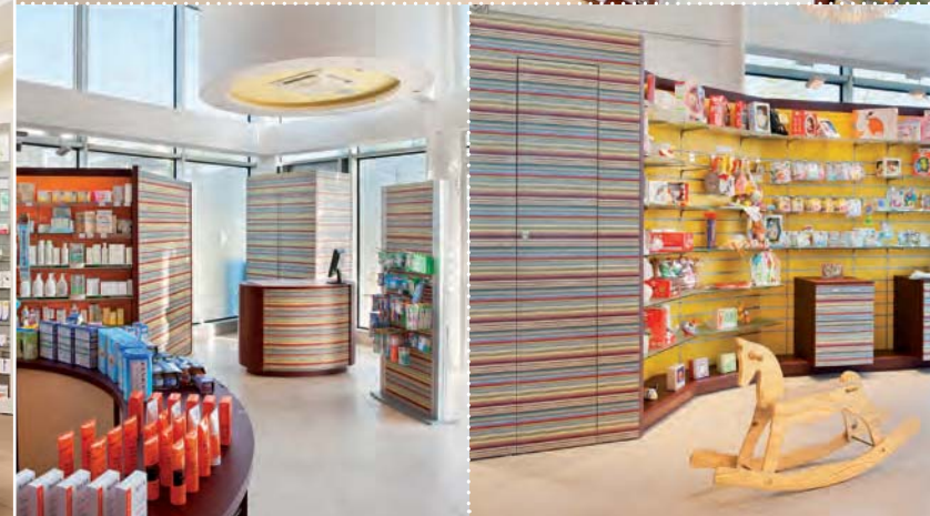
Farmacia PINTAUDI, Gela