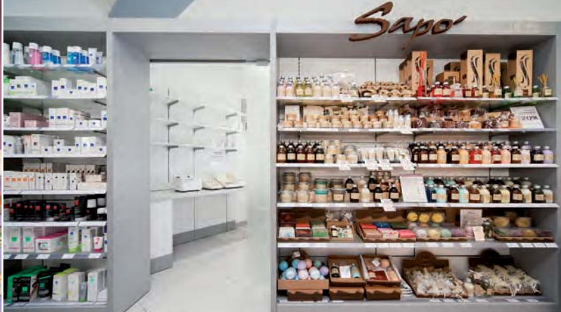
Farmacia TRIVULZIO, Milano